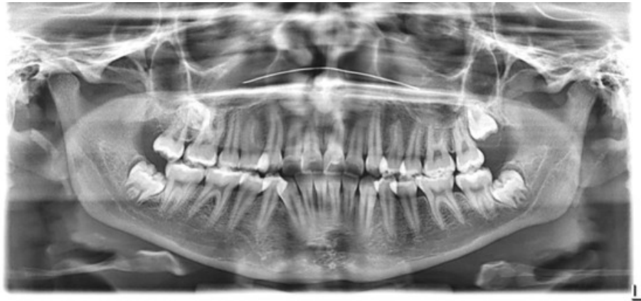
Figura 1. Radiografía Panorámica – Presencia de molar 1.8 en proximidad con molar 1.6.

segundo molar, en relación al piso del seno maxilar, en posición aparentemente transversal y con características de dismorfia, por lo cual se indica estudio de imagen 3D, tomografía dental CONE BEAM.