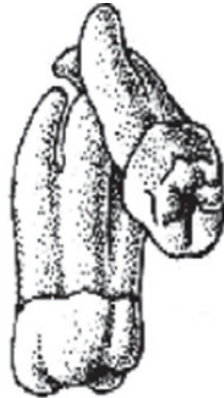
Imagen 1. Concrecencia dental

Nota: figura extraída de Aristizábal-Elejalde D. et al., (2022)