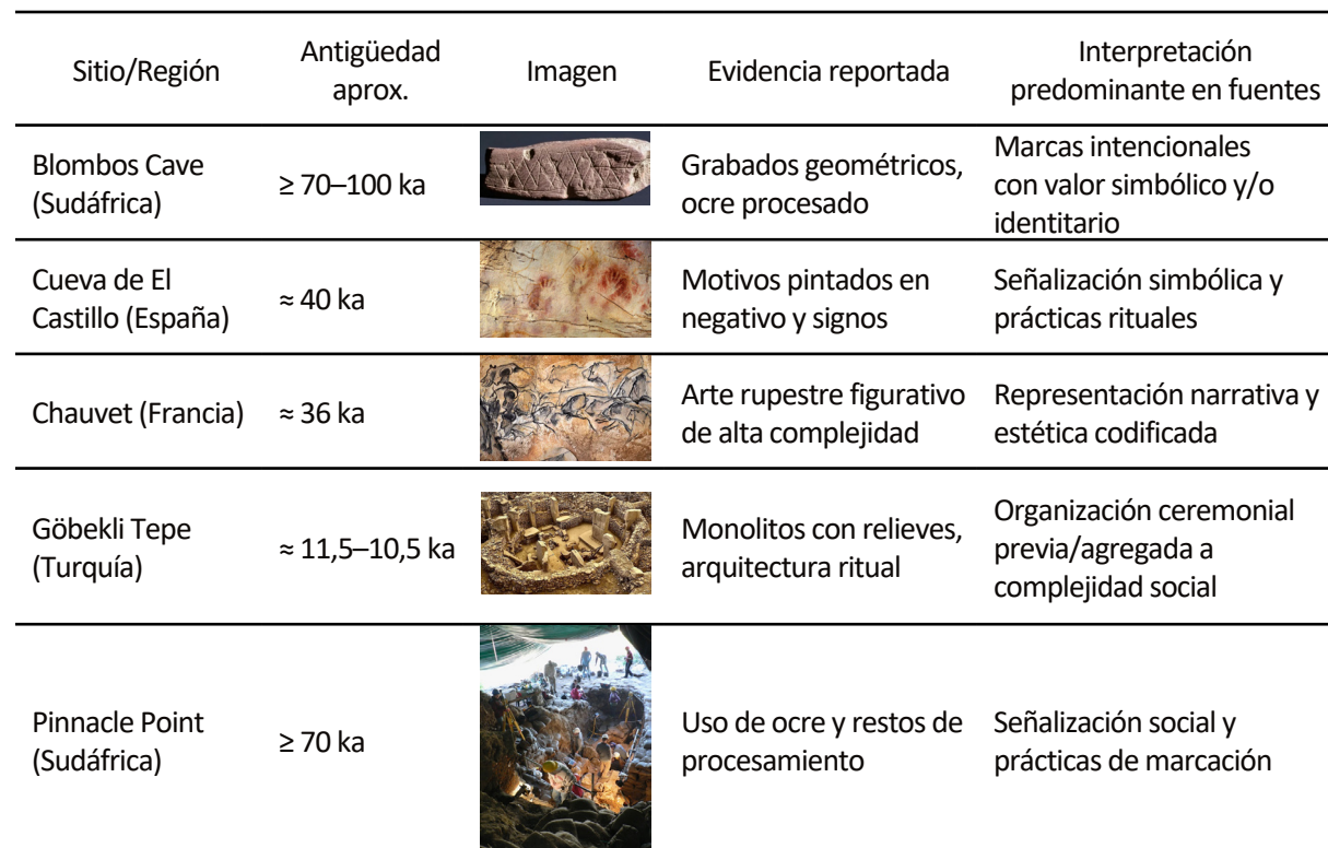
Tabla 3. Evidencias arqueológicas y culturales de simbolismo temprano (selección)

estabilización de significados, control ejecutivo para operar con representaciones abstractas, redes de acceso global para la disponibilidad consciente y circuitos lingüísticos para la codificación y la combinatoria. Aunque el detalle mecánico varía entre estudios, el patrón de coactivación de estos subsistemas se observó de manera reiterada en los textos incluidos.